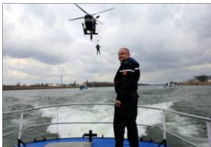
La surveillance du trafic fluvial, la poursuite des infractions en matière de navigation ou les interventions de plongée font partie des missions de cette compagnie sur les 185 km du Rhin français, entre Bâle et Lauterbourg.

Les gendarmes français et allemands ont inauguré hier la compagnie de gendarmerie fluviale franco-allemande, une brigade fluviale unique qui doit permettre des interventions plus efficaces sur le Rhin et qui est basée à Kehl. Cette nouvelle compagnie est constituée de 24 fonctionnaires du Bade-Wurtemberg et de 21 gendarmes français (plongeurs, pilotes, techniciens sonar...). Elle dispose de trois bases, à Kehl et dans les communes alsaciennes de Gamsheim et Vogelgrun.