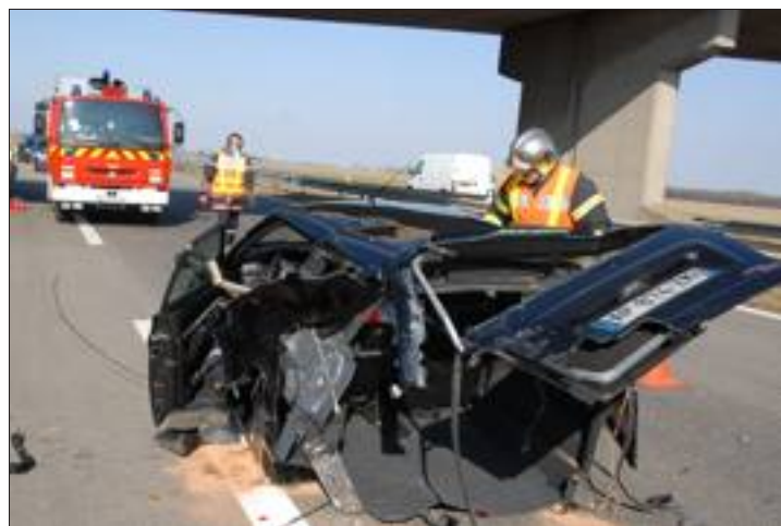
À voir l'état du véhicule, c'est un vrai miracle que le conducteur soit sorti indemne de l'accident. Quant à la voiturette, comme on aurait dit Bourvil, « c'est sûr, maintenant elle va marcher beaucoup moins bien... »