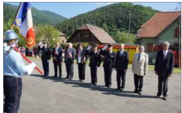
Les officiels ont salué le nouveau drapeau du CPI du Haut-Florival.