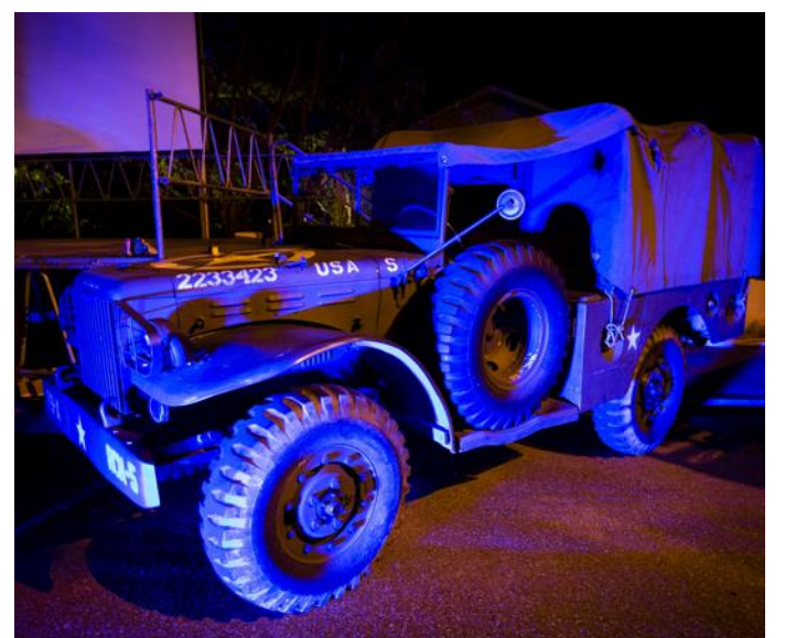
A l'issue du spectacle, les visiteurs ont pu découvrir les véhicules anciens qui rehaussaient la scène.