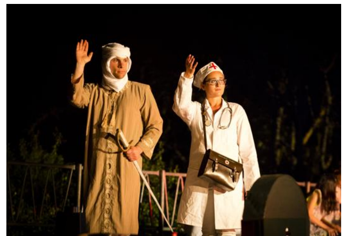
L'ancêtre Alice participe aux campagnes de Lawrence d'Arabie.