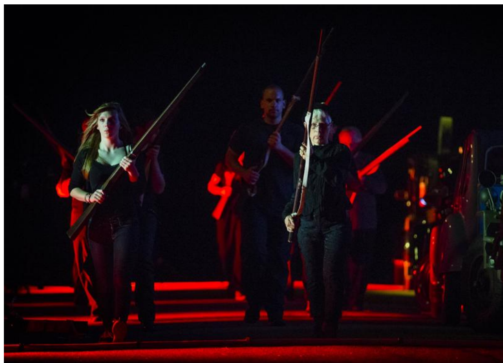
L'histoire de ces pompiers, et de l'Alsace, est marquée par les guerres.